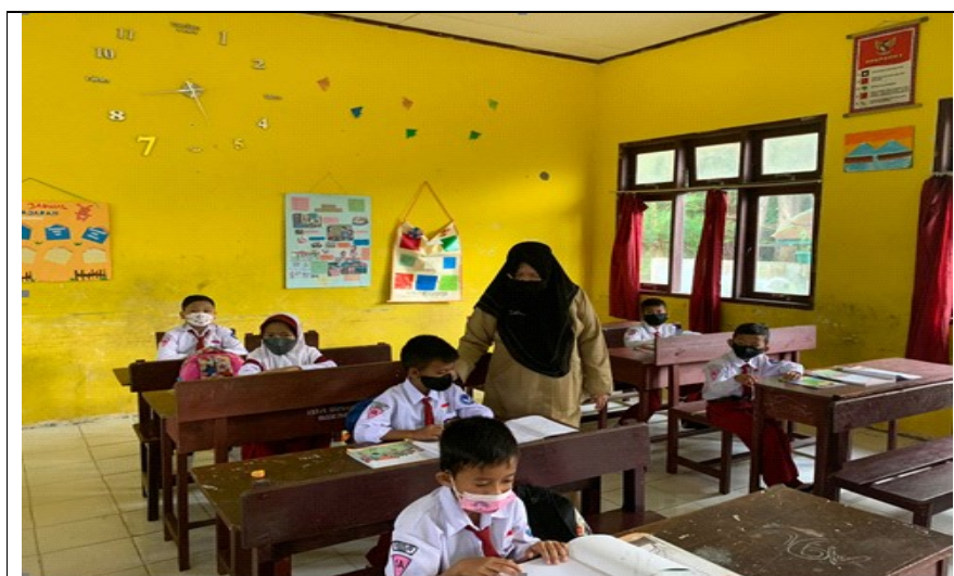
Gambar 2. Salah Satu Kegiatan Penelitian