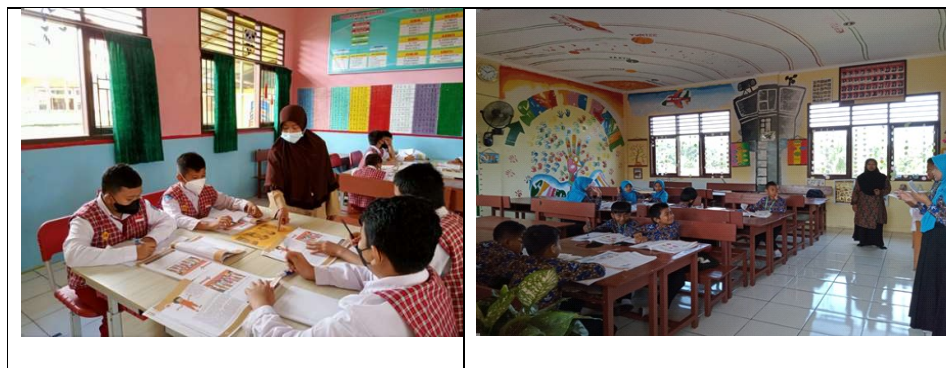
Gambar 1. Suasana dalam Proses Belajar Selama Penelitian

Tempat penelitian bertempat di Kelas IV-B Sekolah Dasar Negeri 004 Teluk Bayur Berau. Sedangkan Waktu Penelitian dilaksanakan pada bulan Juli – Agustus 2022