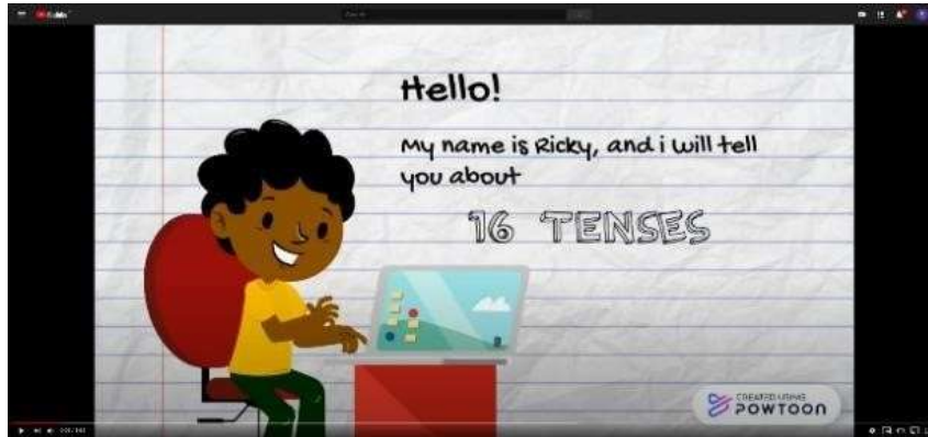
Gambar 1. TAMPILAN VIDEO

dalam Bahasa Inggris. Dalam video tersebut dijelaskan secara rinci jenis-jenis dari tenses yang terikat pada 3 pembagian besar, yaitu kalimat masa lalu, masa sekarang, dan masa yang akan datang. Selain itu, video tersebut juga berisi tips dan trick ciri-ciri dari jenis-jenis tense ; rumus atau pola dari sebuah kalimat yang bertanda kalimat positif, kalimat negatif, dan kalimat interogatif; dan juga contoh dari masing-masing pembagian tersebut.